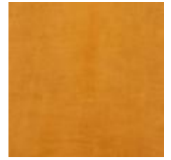
Mööblinahk Vitoria Maple 2828 1100920