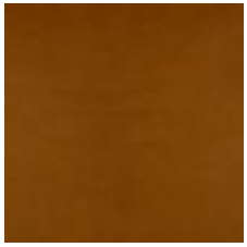
Mööblinahk Oliiv pargitud Vitoria Cognac 2503 1100907