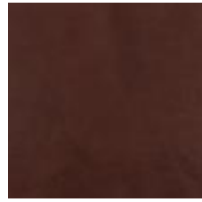
Mööblinahk Vitoria Mahagoni 2387 1100917