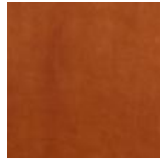
Mööblinahk Vitoria Oak 2603 1100919