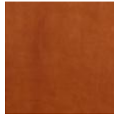
Mööblinahk Vitoria Oak 2603 1100919