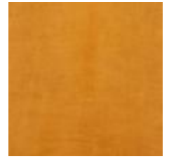
Mööblinahk Vitoria Maple 2828 1100920