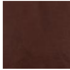
Mööblinahk Vitoria Mahagoni 2387 1100917